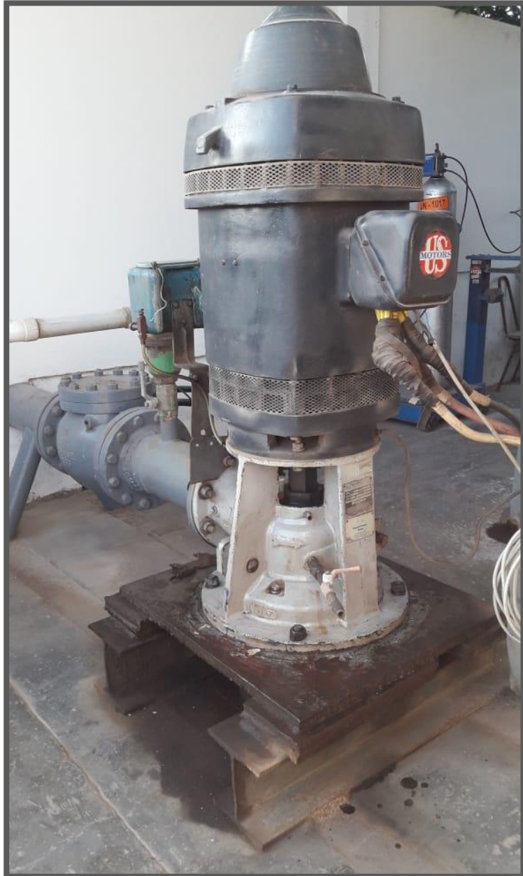
MOTOR ELÉCTRICO POZO DE PARCA